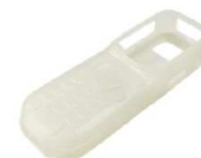
Защитный силиконовый чехол