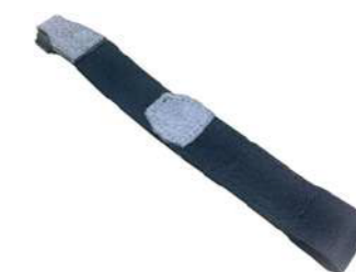
Ремешок на руку