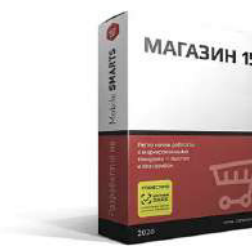
Бесплатная лицензия до 1 сентября 2022 г.